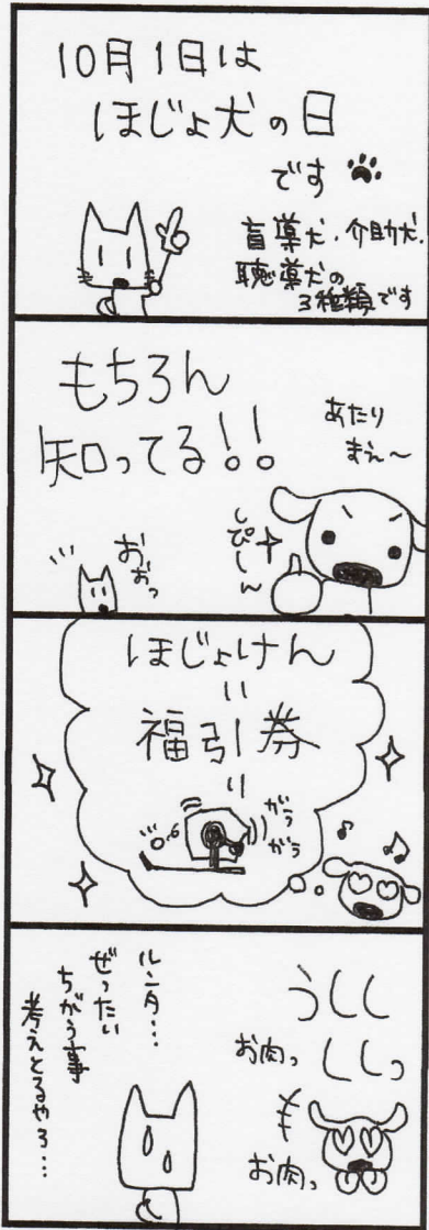
☆補助券とははく補助犬です☆