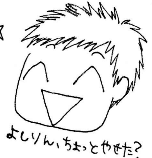
よしりん、ちよとやめた?

!! あずみんが" JJ"に来る!! 廿日市市 女いっくろざ (笑) (16日(木) 14時~15時) マチ手話教室 (19日(土) 18時~) タクミ-テング 講演するよ